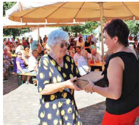
Faluszépítés, virágosítás, fásítás (önkormányzati hozzájárulással)