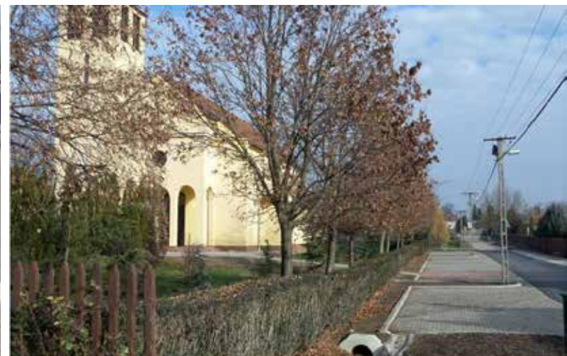
Járdát építettünk az Arany János utcában (egyik oldalon), mindkét oldalon kapubejárókat alakítottunk ki.