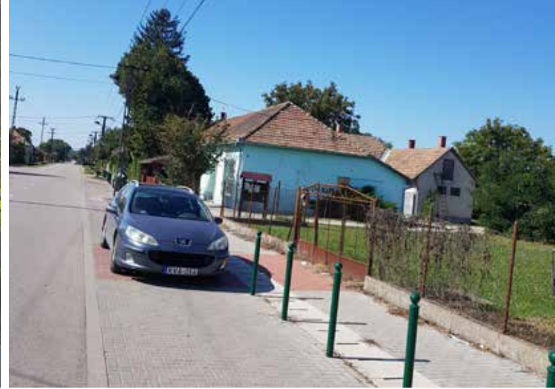
Az Ady Endre utcában 18 férőhelyes parkolót alakítottunk ki a katolikus templom mellett, továbbá a Faház Vendéglő előtt térköves parkoló épült, az utca jelentős része új aszfaltburkolatot kapott.