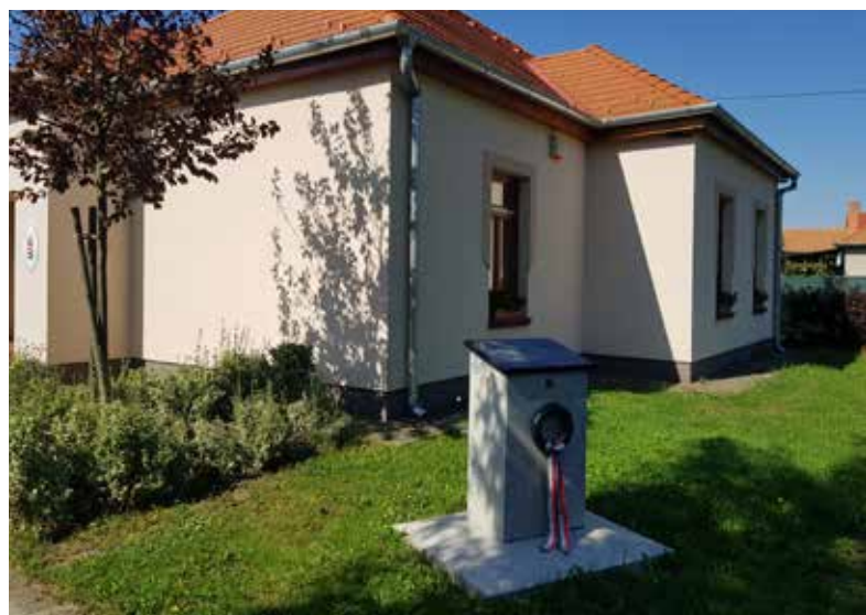
Művelődési Házunkat Nagy Lászlórról, községünk pedagógusáról, népművelőjéről neveztük el.