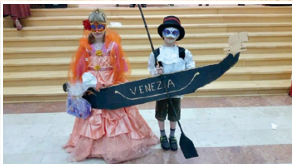
A jelmezes verseny győztesei