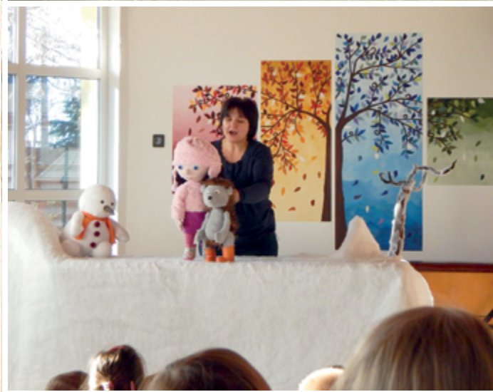
Nefelejcs bábszínház: Süni és a kislány