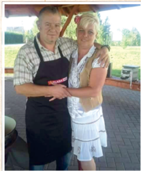
Dózsaék mint főszakácsok