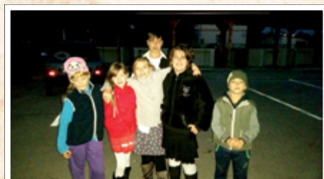
A legkisebb szabadegyházi néptáncosok