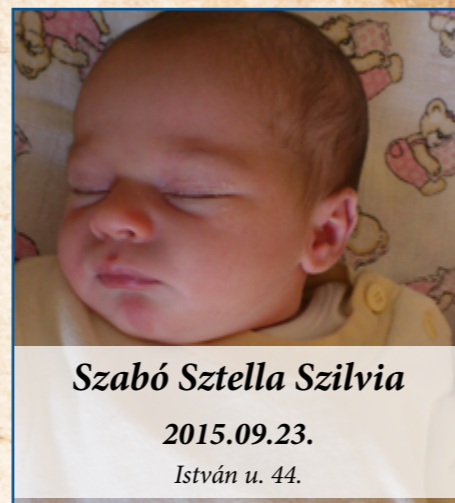
Szabó Sztella Szilvia