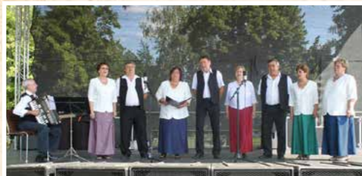
Vadon Nőtt Gyöngyvirág Dalkör