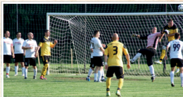
Csupor légiharcot vív a soponyai kapussal

Május 17-én Pusztaszabolcs fogadta a Kinizsit. A mérkőzésnek sok tétje nem volt, hisz az előttünk álló, szabolcsiakat győzelem esetén sem érthetjük már be és