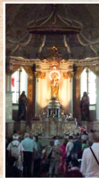
A csíksomlyói kegytemplom

ki gyalogosan, ki szekéren, mások gépjárművel. A zarándoklat mára túlnötte múltját, nemcsak Erdélyből, hanem a világ minden tájáról érkeznek ide magyarok, így napjainkra a csíksomlyói pütkösi búcsú az összmagyarság ünnepévé vált vallási hovatartozásra való tekintet nélkül.